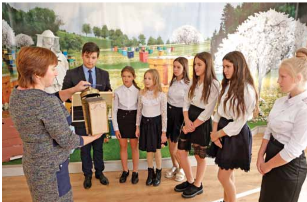
В музее мёда Владимировской школы