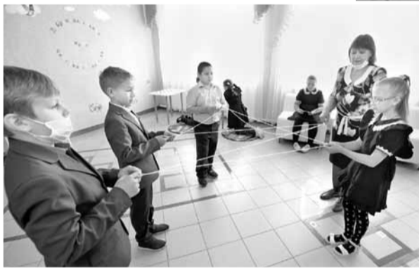
Четвероклассники играют в «Паутинку добра»