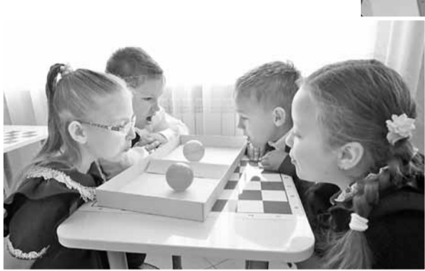
Дыхательная гимнастика на интерактивной переменной