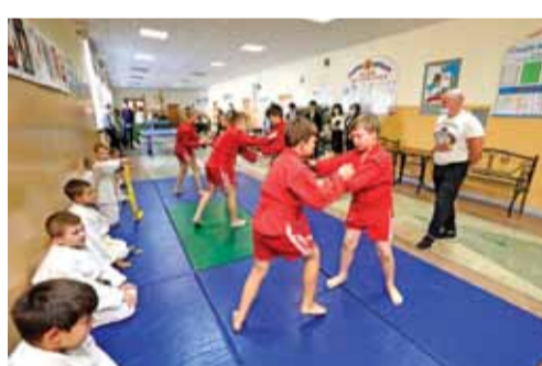
В Ивнянской школе № 1 действует секция самбо и дзюдо, где занимаются более 50 мальчишек и девчонок