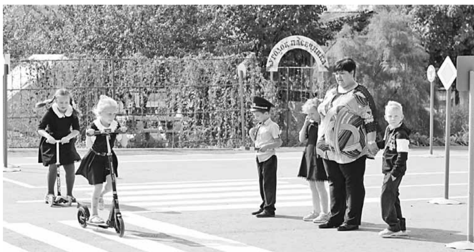
В «Автогородке» школьники на практике учат Правила дорожного движения

ЗА 45 ЛЕТ КЛИМЕНКОВСКАЯ ШКОЛА ВЫПУСТИЛА 575 УЧЕНИКОВ, 24 ИЗ НИХ НАГРАЖДЕНЫ ЗОЛОТЫМИ И СЕРЕБРЯНЫМИ МЕДАЛЯМИ, 30 СТАЛИ ПЕДАГОГАМИ (12 ИЗ НИХ ВЕРНУЛИСЬ ПРЕПОДАВАТЬ В РОДНУЮ ШКОЛУ).