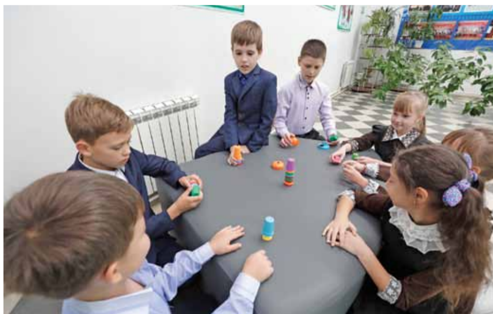
В художественно-эстетической зоне Верхоненской школы можно и проводить занятия, и играть