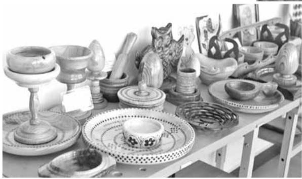
Изделия из дерева, сделанные школьниками на уроках технологии