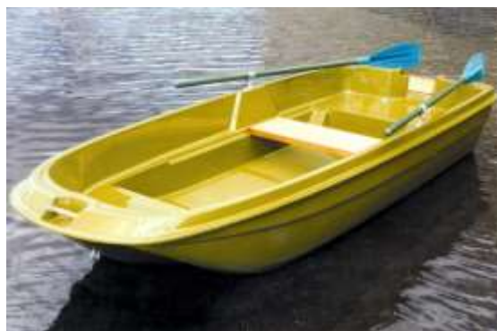
ло д ка