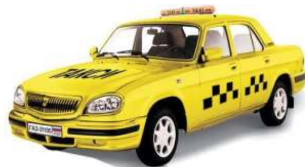
та к си